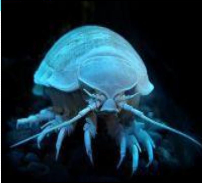
Гигантские изоподы крупные равноногие раки.