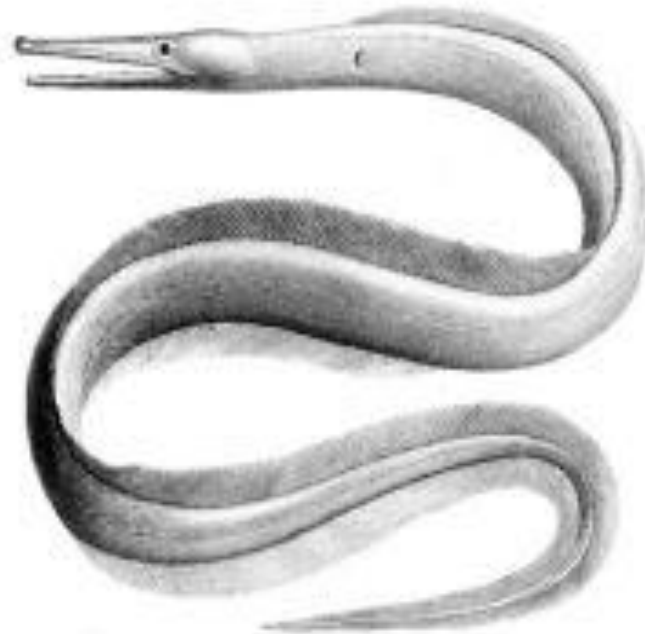
Морской угорь, обитающий только в прибрежных водах Атлантического океана и в западной части Средиземного моря. Имеет прозвище «колдун-черный плавник».