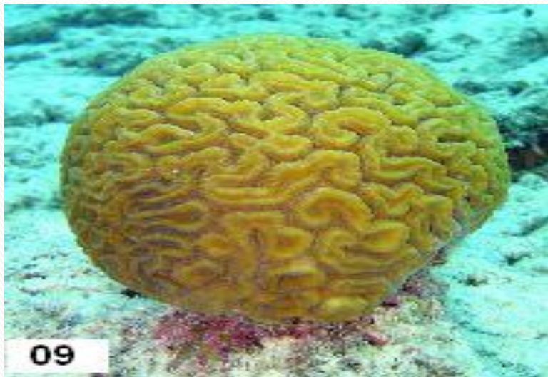
Коралл - мозговик