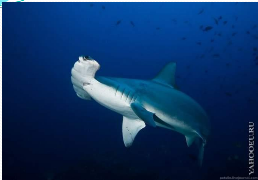
Рыба - Молот