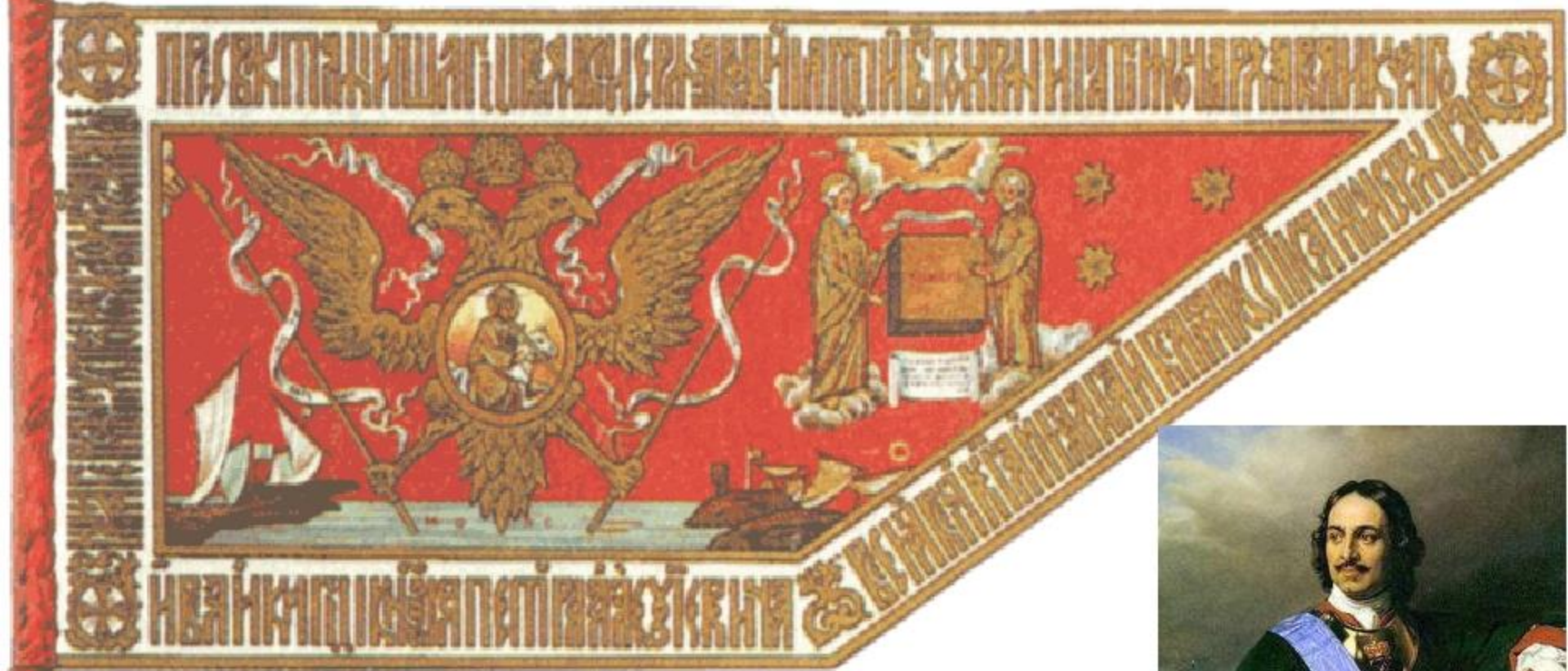
Гербовое знамя 1696 г.