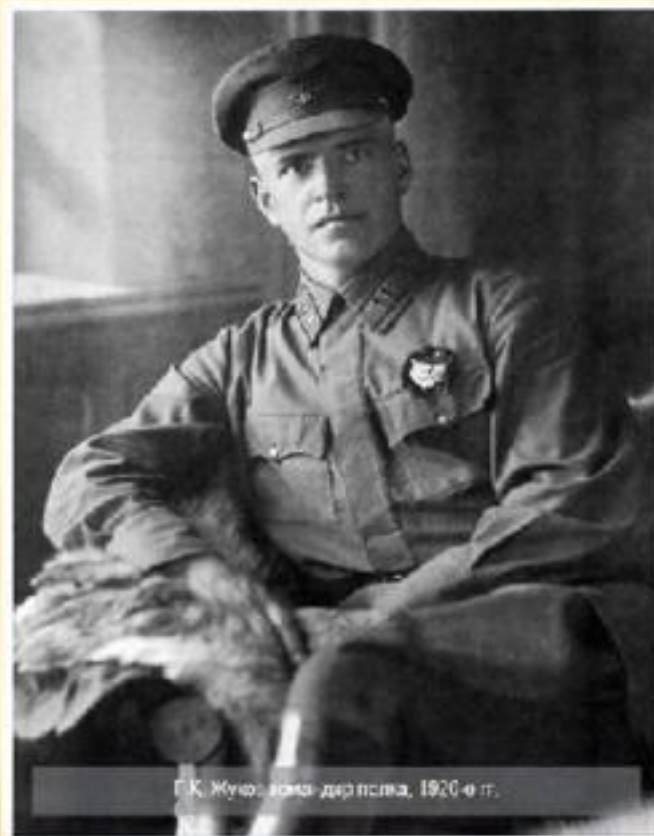
Г.К. Жуков, командир полка, 1920-е гг.

Гражданскую войну Жуков закончил командиром эскадрона, а весной 1923 года стал командиром кавалерийского полка. Ему было тогда 26 лет. В марте 1933 года Георгий Жуков был назначен на должность командира 4-ой Донской Кавалерийской имени К.Е.Ворошилова дивизии Первой Конной Армии.