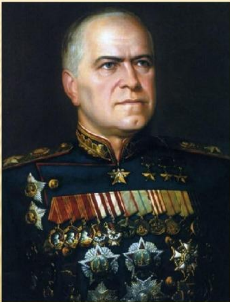
Георгий Константинов ич Жуков