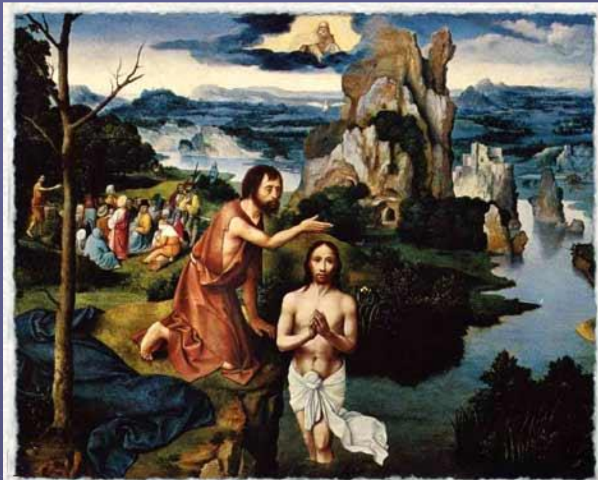
1515/1524 гг. Иоахим Патинир. Крещение Христово. Дерево, масло. 60x77 см. Вена, Музей истории искусств.

Когда Иисусу исполнилось 30 лет, он пришел на реку Иордан к Иоанну Крестителю, чтобы принять от него крещение.